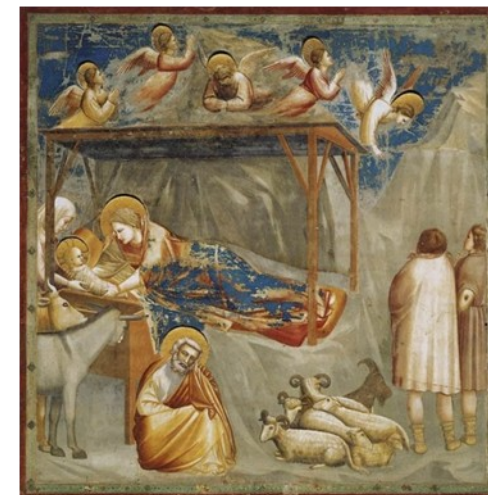
Giotto - Cappella degli Scrovegni (Padova)

La tradizione ci invita, attraverso l'immagine del presepe, a confrontarci con noi stessi, a gioire della vita e a far sì che ogni giorno sia un giorno natale.