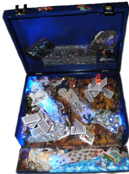
Sandra Coluccia - I passi della speranza